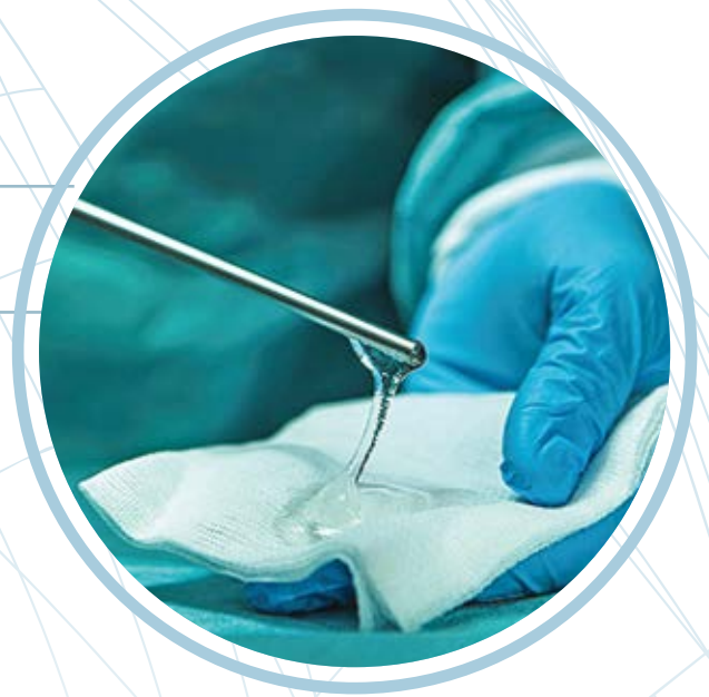
Produit anti-adhérentiel jouant son rôle de barrière

1 seringue de 10ml avec un applicateur semi-rigide de 15cm